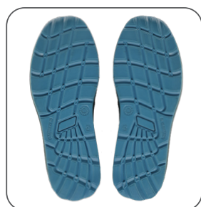
podešev outsole podeszwa