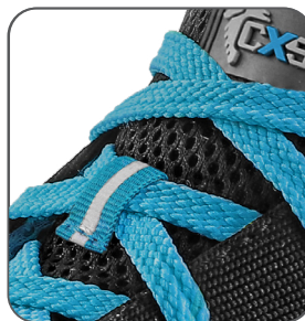
reflexní doplňky reflective accessories elementy odblaskowe