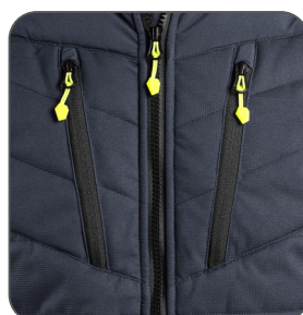
náprsní kapsy náprsné vrecká chest pockets kieszenie na piersi